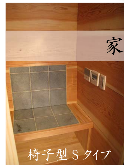
椅子型 S タイプ