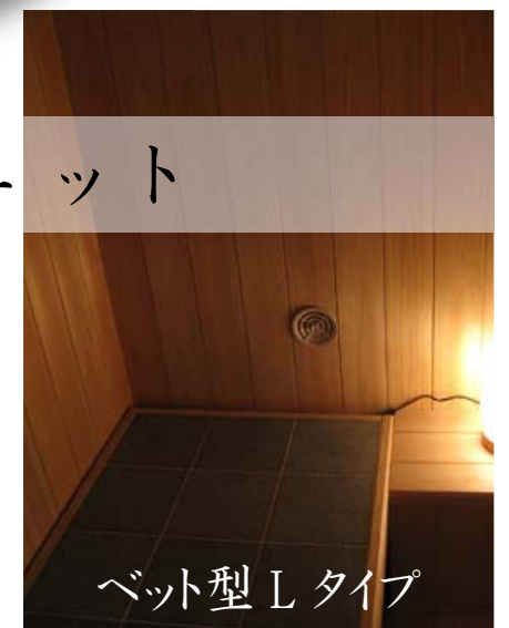
ベット型 L タイプ