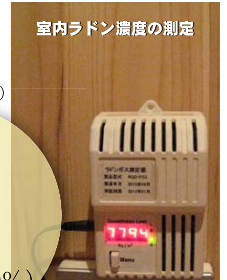
室内ラドン濃度の測定

ラドン 濃度 (1000 ~ 10000 ベクレル) ラジウム線量 (2 ~ 20 マイクロシーベルト)