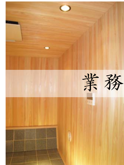
業務用ラドンセラピーユニット

岩盤温熱浴ラドンセラピーはユニット型に開発され、浴室バスユニットと同じくドア一枚から搬入可能とした現地組み立てタイプで業務用もあります。また、弊社は1級建築士6名を含む10名の技術者集団ですので設計から施工まで、お客様のご要望に合わせた室内改修工事のホルミシスルームの施工も賜ります。