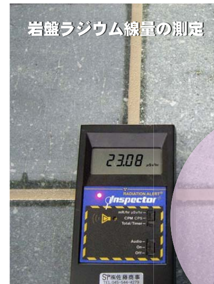
岩盤ラジウム線量の測定

ラドン 濃度 (1000 ~ 10000 ベクレル) ラジウム線量 (2 ~ 20 マイクロシーベルト)