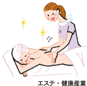
エステ・健康産業